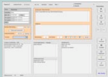
Praxissoftware Patients 2009 für Windows Vista /XP und MacOS X

Sieht Man(n) / Frau sich einmal genauer den Bereich Gesundheitswesen an, so verzeichnet die statistische Erhebung für das Jahr 2007 insgesamt rund 24.000 Heilpraktiker/innen - und Man(n) staune, davon sind 18.000 Frauen!