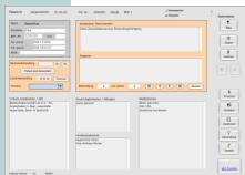
Praxissoftware Patients 5 für Windows Vista / XP und MacOS X