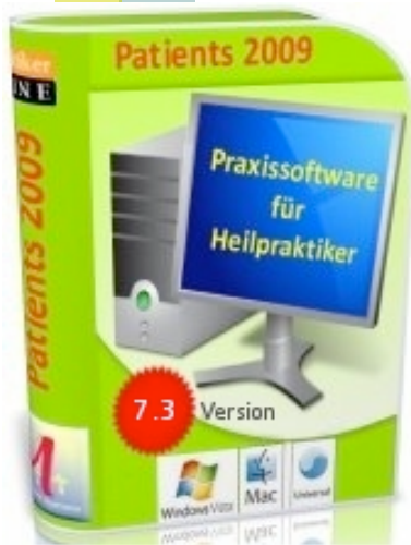
Praxissoftware Patients 2009 für Windows Vista /XP und MacOS X

Rückblickend auf das 1. Quartal 2009 verzeichneten rund 43% der HP-Praxen eine rückläufige Umsatzentwicklung, bei 17% gab es keine Veränderung gegenüber dem Vorjahrszeitraum.