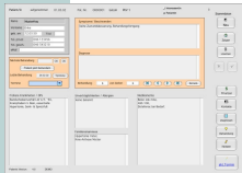
Praxissoftware Patients 2008 für Windows Vista /XP und