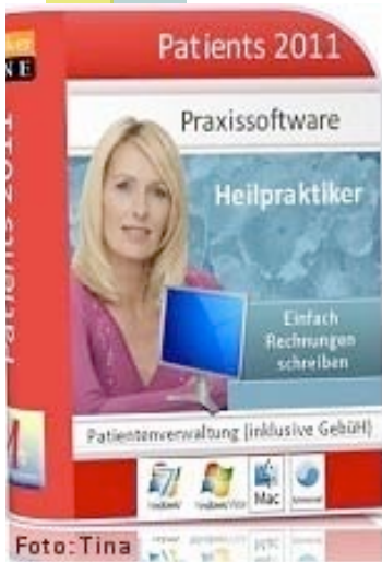
Praxissoftware Patients 2011 für Windows 7 / Vista / XP und MacOS X